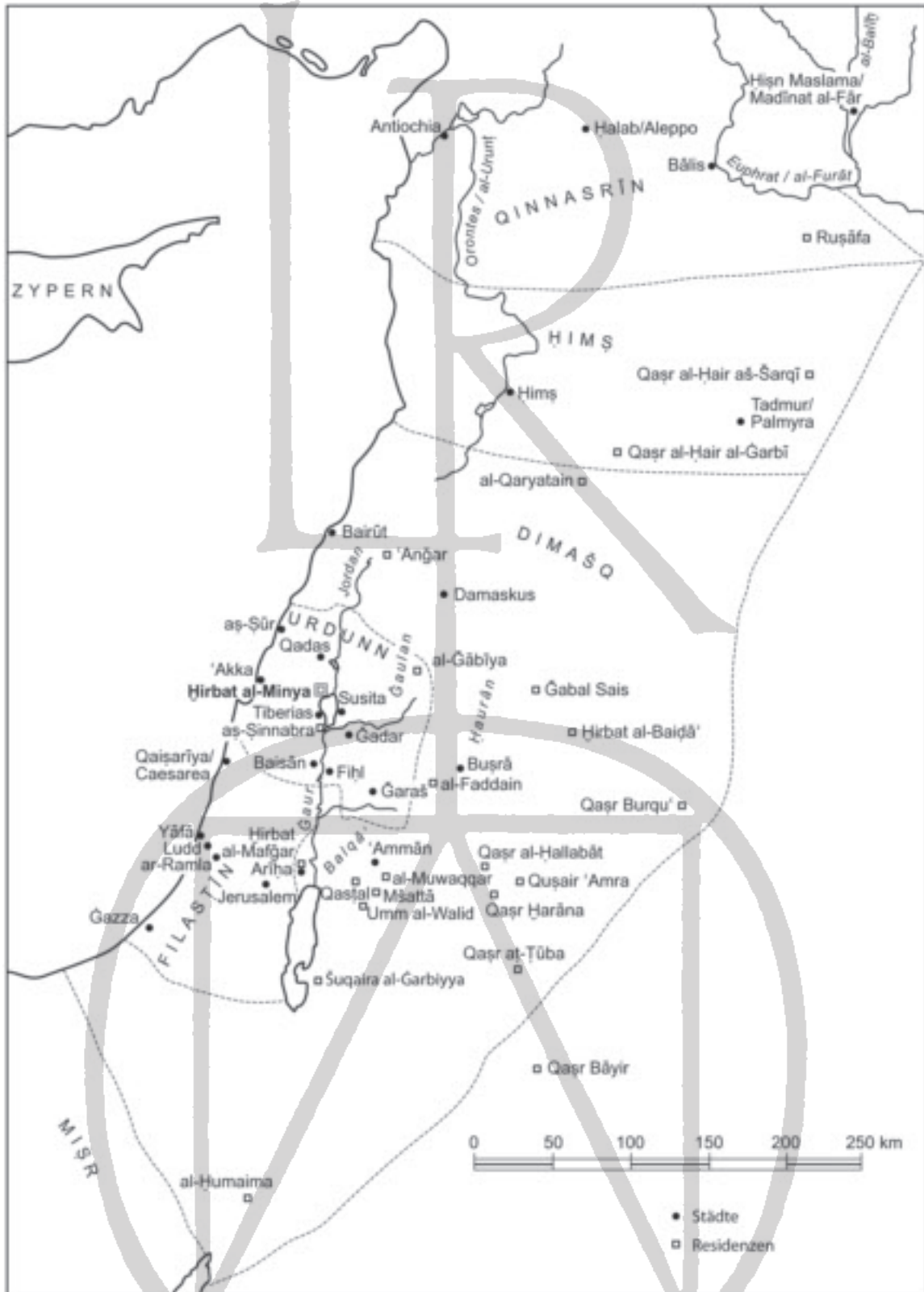
Abb. 1 Die Provinzen des Umayyadenreiches am östlichen Mittelmeer und die Lage von Hirbat al Minya zu anderen Residenzbauten der Bilād aš-Šām