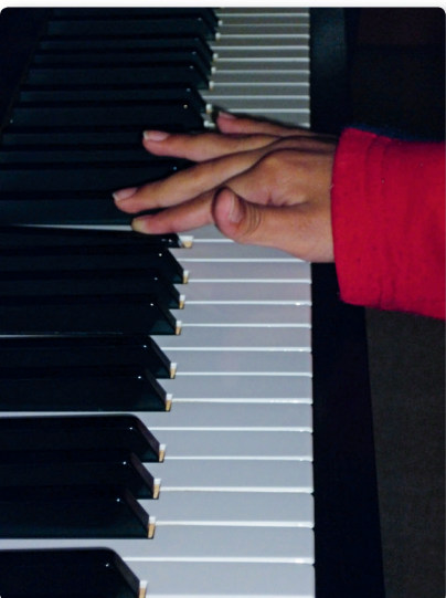
Klinikspaziergang. Landesbildungszentrum für Blinde · 9