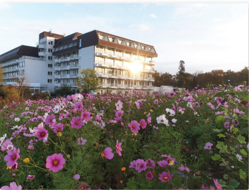
Klinikspaziergang. MEDIAN Klinik Flechtingen · 5