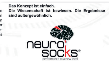
Capriccio cerebrale · 26