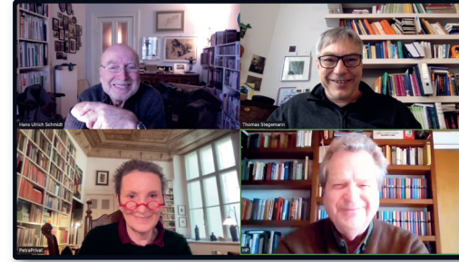
Zur Person · 31