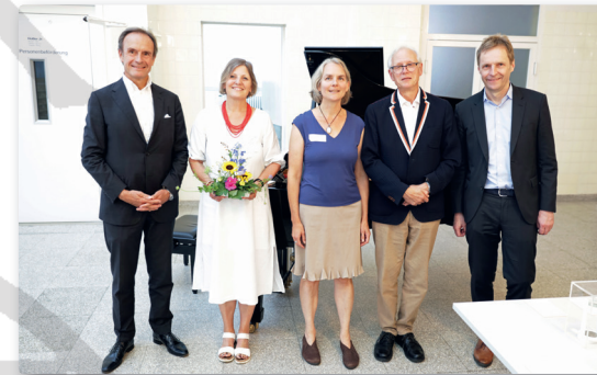
Bericht über die 2. Science und Sounds Conference Hamburg · 42