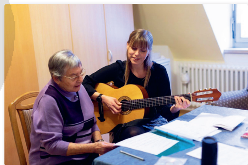
Schwerpunktthema · 30