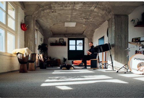
Praxisvorstellung · 8