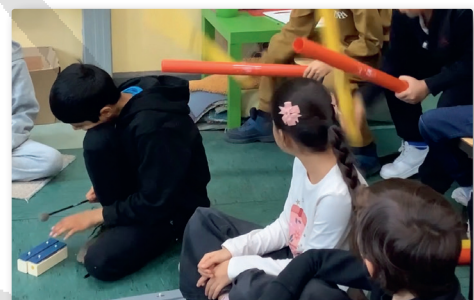
Musik zur Integration · 33