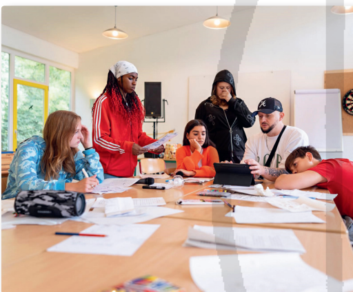
Schwerpunktthema · 20