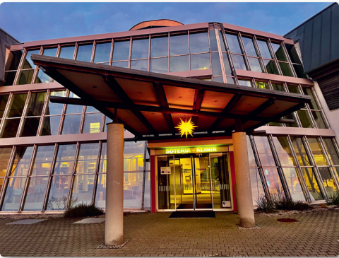
Klinikspaziergang · 5