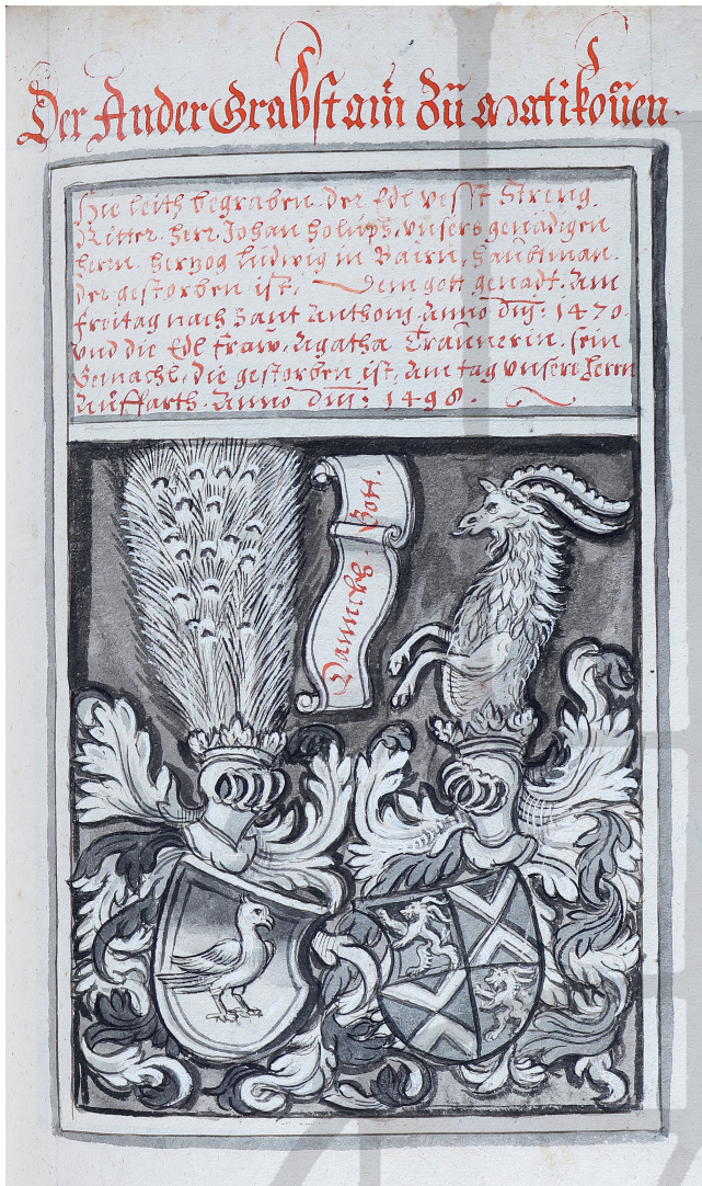
Abb. 4: „Trauner Chronik“ (Stiftsarchiv Heiligenkreuz CA 583), fol. 288r: lavierte Federzeichnung der Wappengrabplatte des Johann Holub und der Agatha Trauner († 1498) in der Pfarrkirche Matighofen (Polit. Bezirk Braunau, Oberösterreich)

Sammlungen, 19 ausschlaggebende Überlegungen für die Drucklegung knüpften sich naheliegenderweise an Fragen des potentiellen Käuferinteresses und Absatzes.