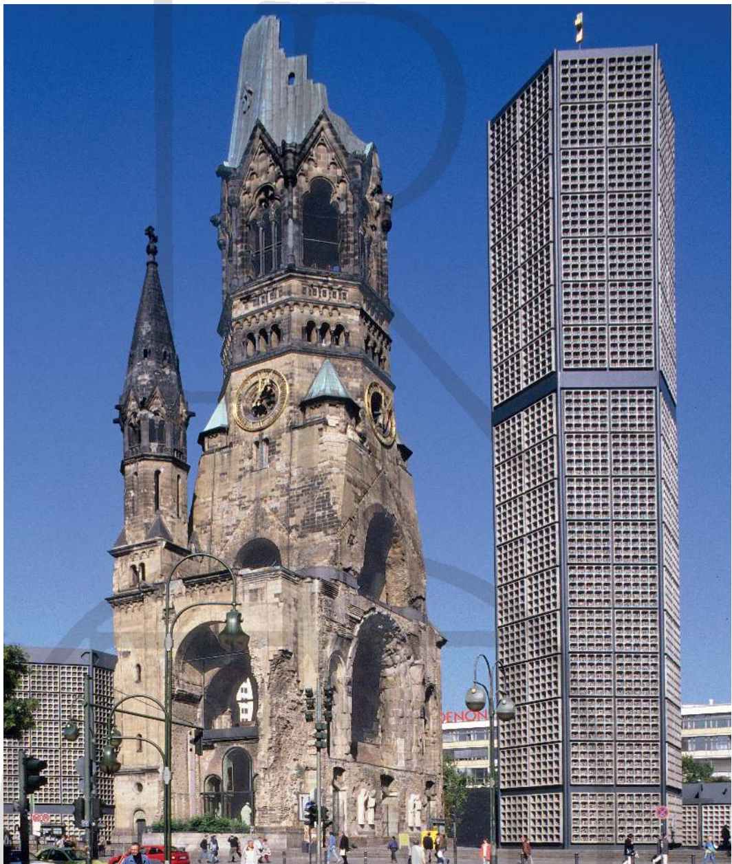
Abb. 3 Die kriegszerstörte Turmuine und der neue Glockenturm der Kaiser-Wilhelm-Gedächtnis-Kirche: Berliner Symbol des Wiederaufbauwillens nach dem Zweiten Weltkrieg

des Kolloquiums eindrücklich. Immer muss es aber darum gehen, Hilfestellung zu leisten und die Menschen darauf vorzubereiten, dass sie in der Post-Conflict-Situation ihre Entscheidungen über den Umgang mit dem beschädigten oder sogar zerstörten kulturellen Erbe eigenverantwortlich treffen können.