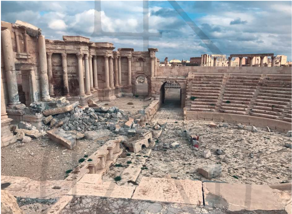
Abb. 1 Das römische Amphitheater in der antiken Stadt Palmyra nach den Zerstörungen von Anfang 2017

Die Bilder der Sprengung der Tempel in Palmyra erreichten im Sommer 2015 die Weltöffentlichkeit in hochauflösenden Bildern und Videos. Der sogenannte Islamische Staat inszenierte sein Zerstörungs-