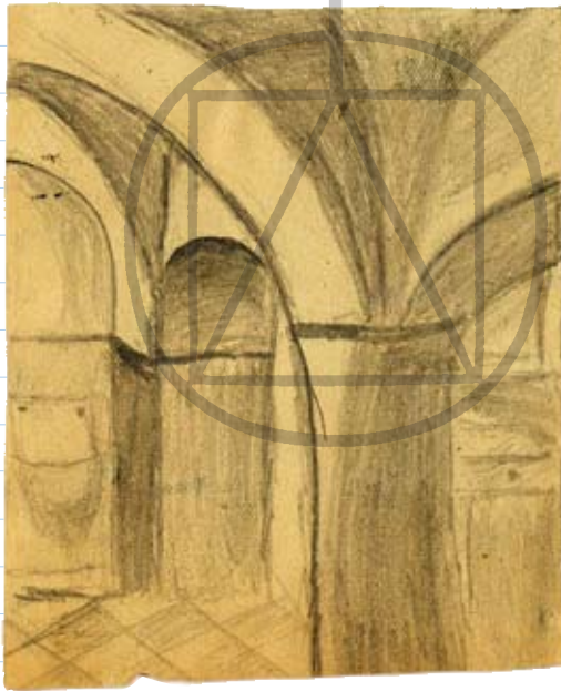
Die gewölbte Küche.